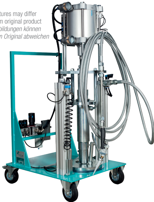
Example picture with Ultra-Light Gun Beispielbild mit Ultra-Light Versiegelungspistole

* Pictures may differ from original product Abbildungen können vom Original abweichen